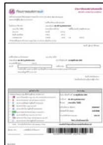
ใบแจ้งการชำระเงิน