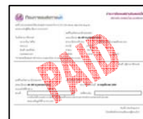
หลักฐานการชำระเงิน