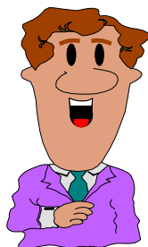
ผู้ชำระเงิน

3. ผู้ชำระเงินเก็บหลักฐานการชำระเงินที่ ธนาคารออกให้ เพื่อเป็นหลักฐานการชำระเงิน