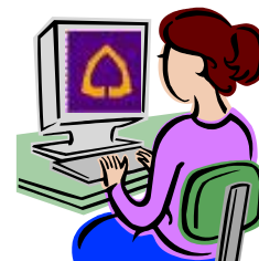
สาขา ธ.ไทยพาณิชย์

2. ชำระเงินตามที่ระบุไว้ในใบแจ้งการชำระเงิน พร้อมค่าธรรมเนียมเรียกเก็บ(ถ้ามี) พนักงานจะ ทำรายการ และออกหลักฐานการชำระเงินให้